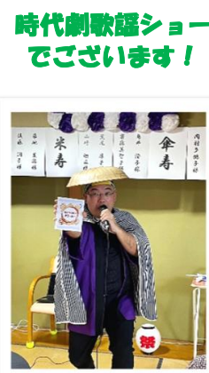
時代劇歌謡ショー でございます！