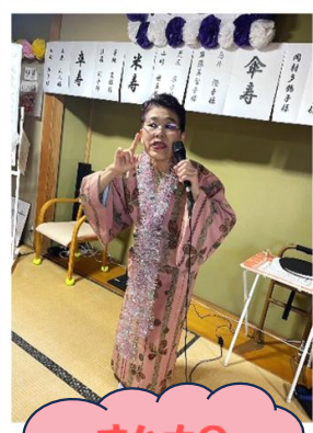
オハナの 都はるみです♪